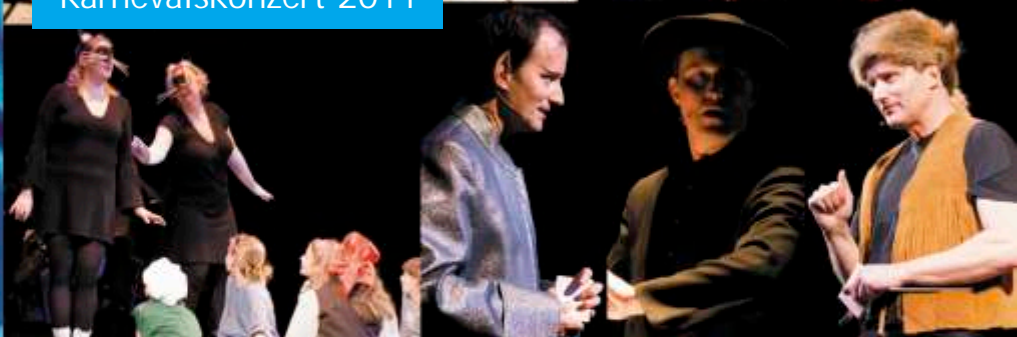
Musikalisch maskiert! – Kumm loss mer fiere!