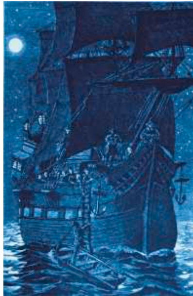
An Bord des Fliegenden Holländers (Illustration von Johannes Gehrts, 1887)

Daland, geblendet von der Erscheinung und dem Reichtum des Holländers, lässt sich